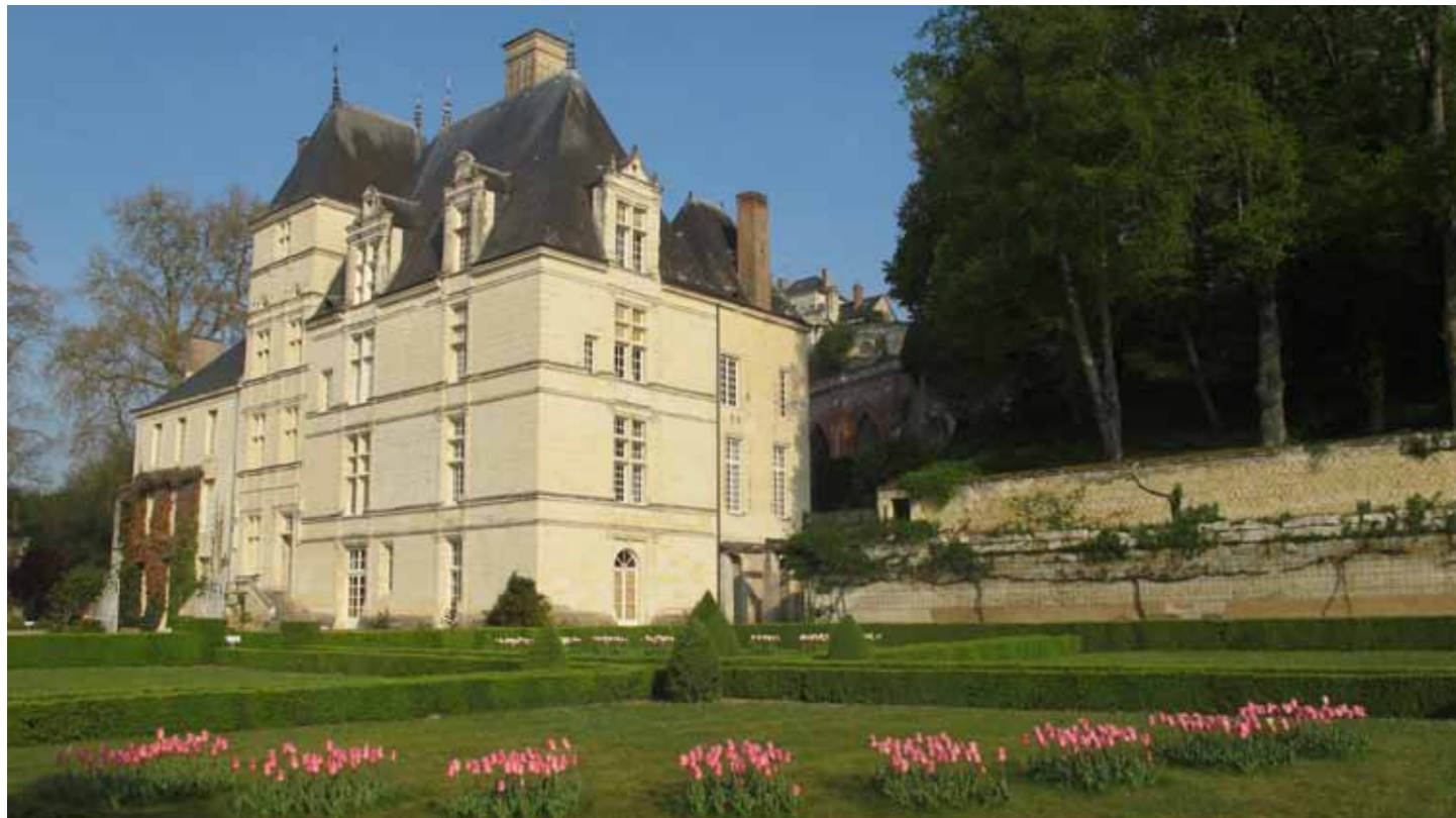
Le Château de Poncé, le jardin à la française et la folie 1830