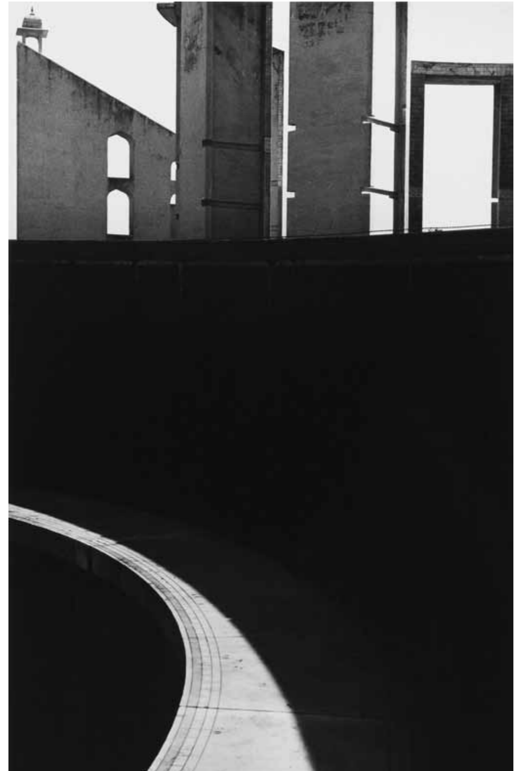
Lucien Hervé, Observatoire de Jaipur , photographie tirage moderne signé, 29,3x19,2cm, 1955