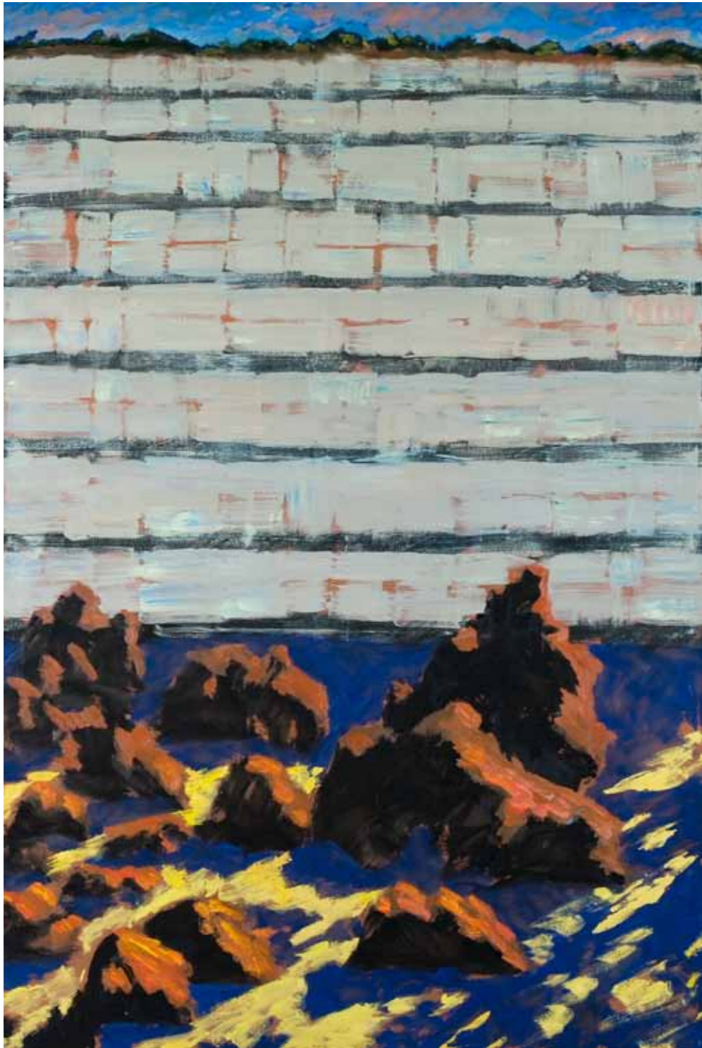
Guy de Malherbe, Sans Titre , huile sur toile, 130x197cm, 2013