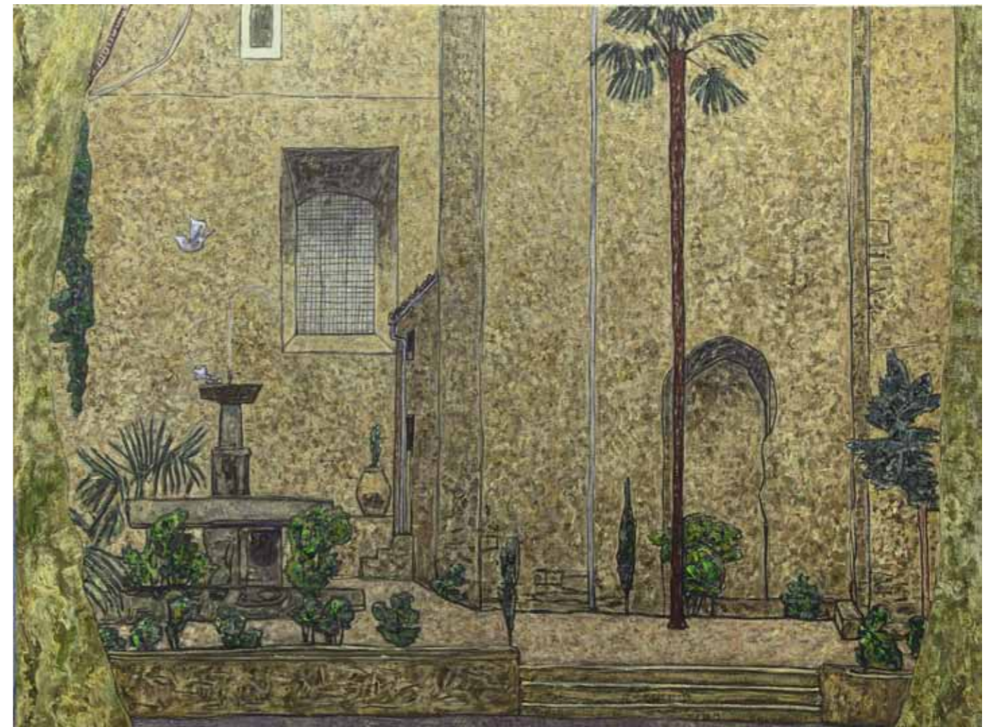
Vincent Bioules, Le Chevet de l'église de Ceret , huile sur toile, 150x200cm, 2013