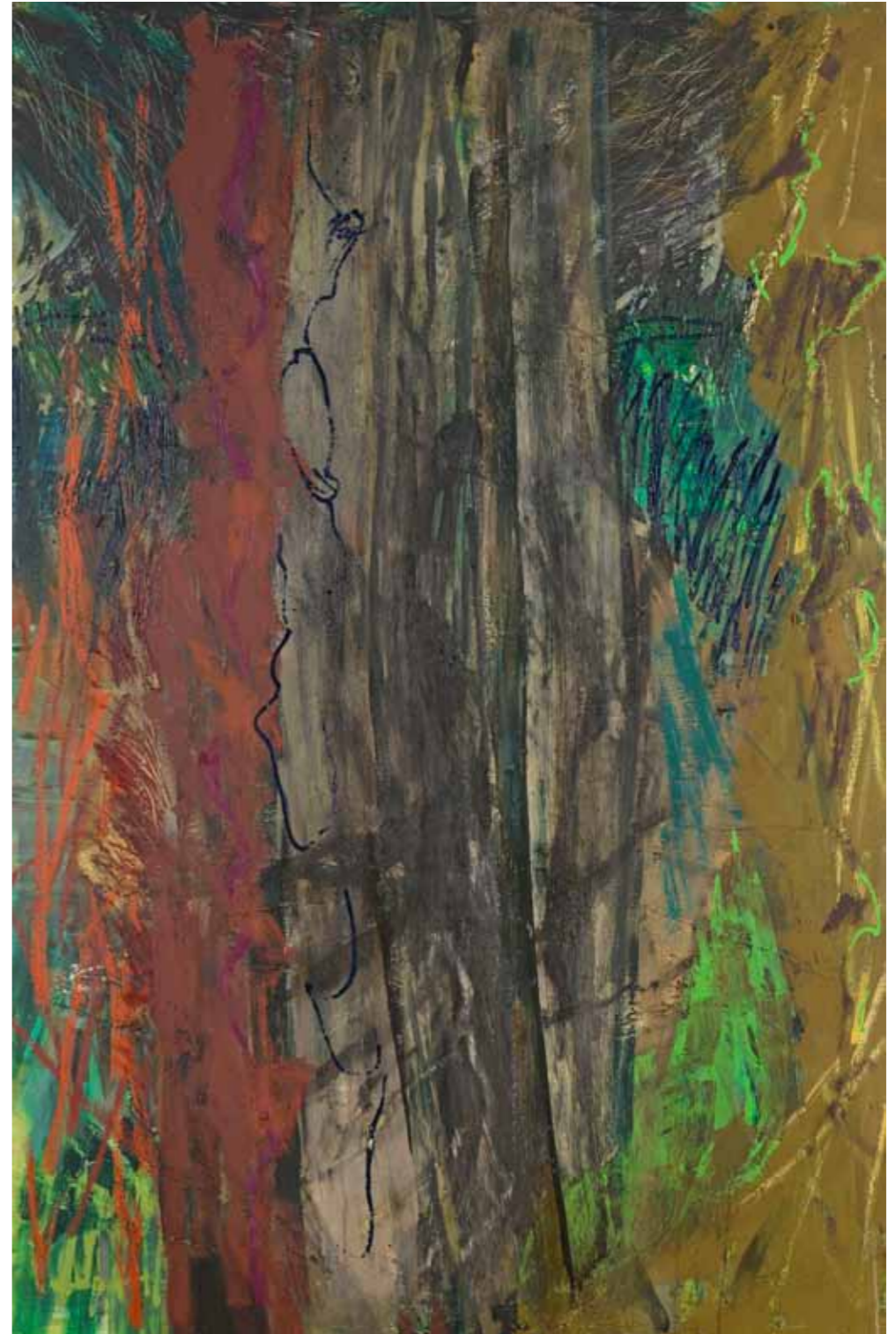
Per Kirkeby, Sans titre , huile sur toile, 200 x 130cm, 2008.