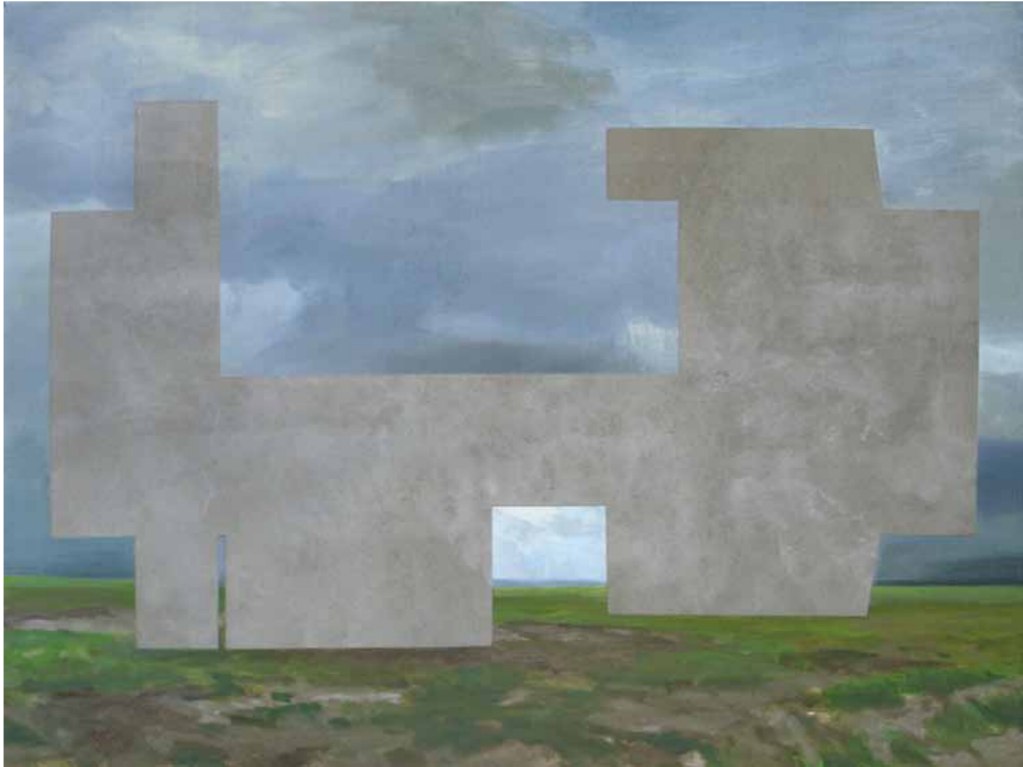
Arthur Aillaud, Sans Titre , huile sur toile, 130 x 195cm, 2011.