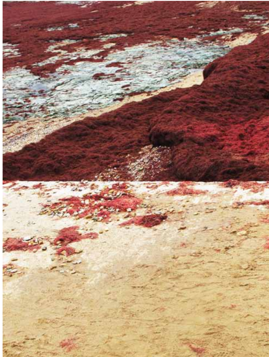
Sarah Le Guern, Jetée Rouge , 100 x 70cm, photographie tirage C-print sous diassecc, 2/5, 2013.