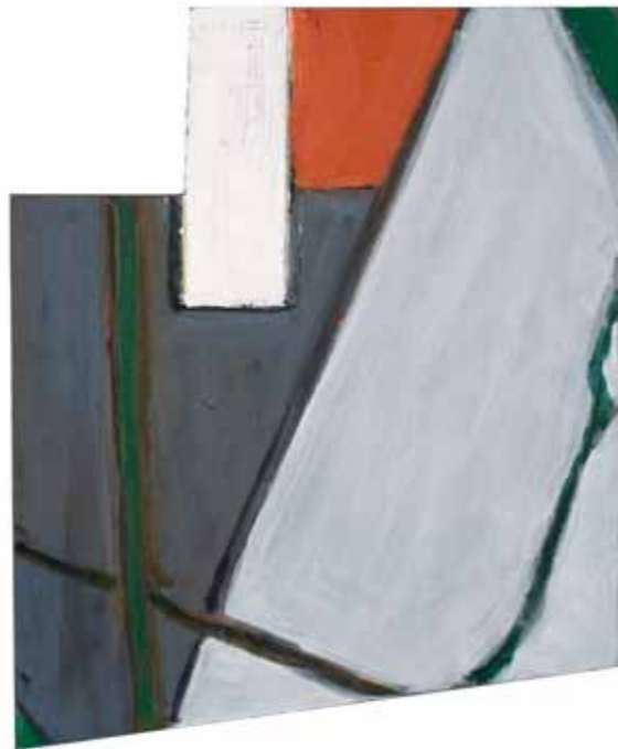
Pierre Buraglio, Rue Renato Guttuso III , Huile sur contreplaqué, découpe, 30,5 x 25cm, 2012