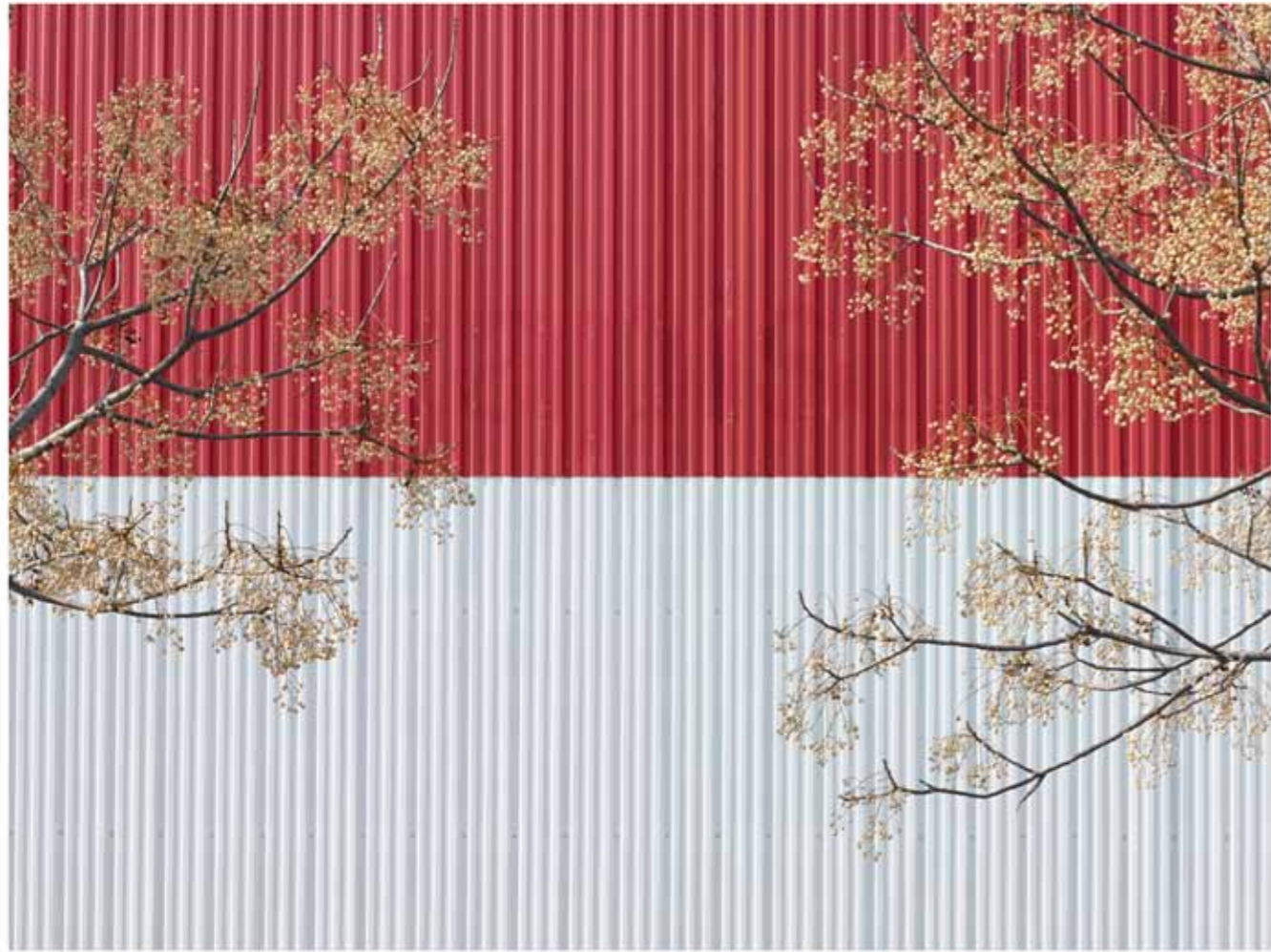
Jérôme Bryon, Grand sud, Landscape , photographie tirage argentique, 80 x 100cm , 3/6, 2013.