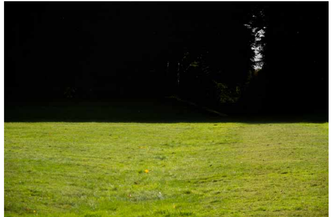
Illés Sarkantyu, « Buraglio », Allée Cavalière, Kerguehenec , 2013 Tirage pigmentaire contrecollé sur dibon, 60x80 cm