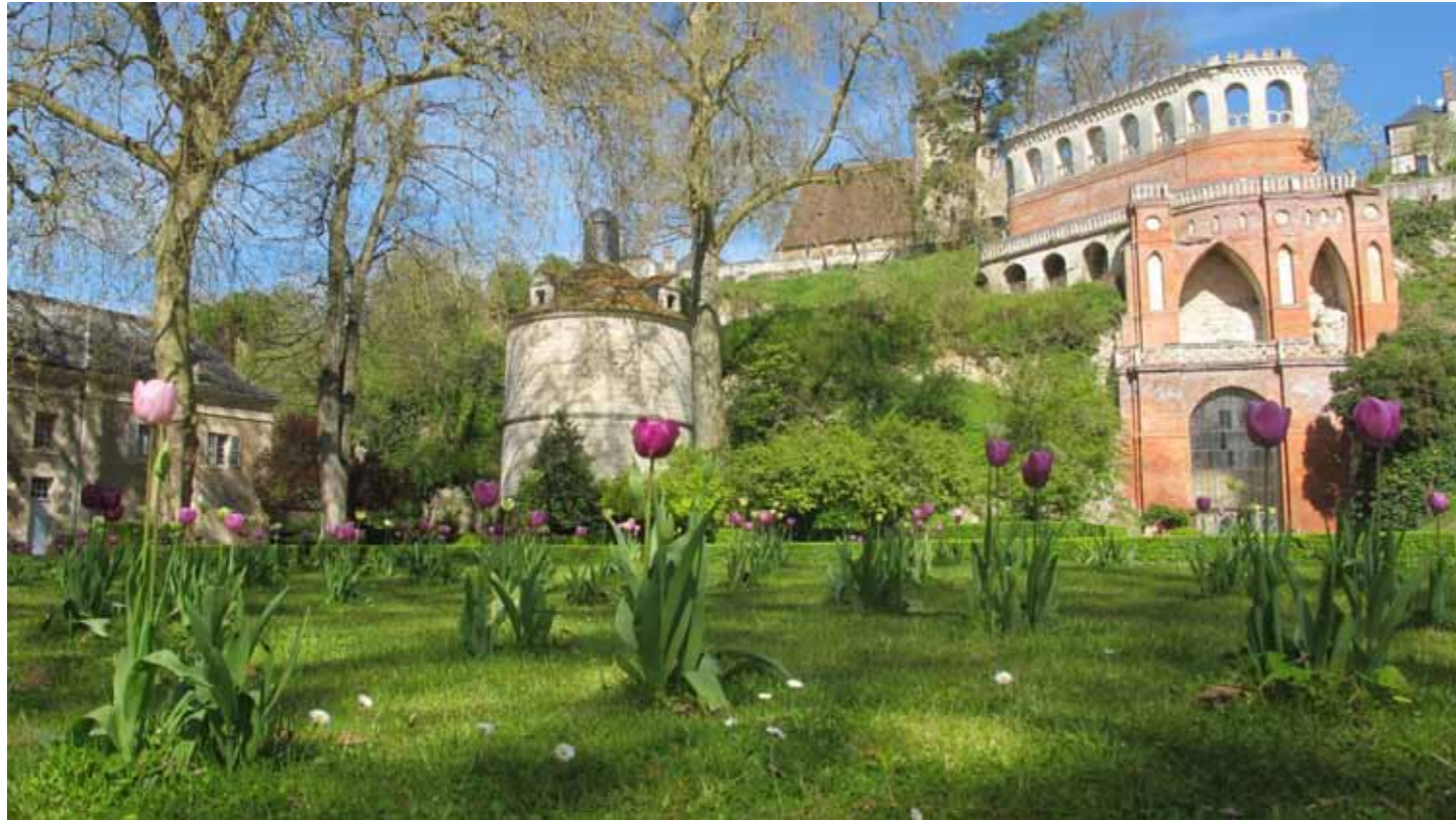
Les dépendances XVIIIe siècle, le pigeonnier et la folie 1830 du jardin du Château de Poncé